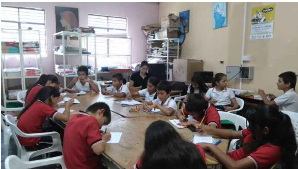
Planteando el Problema de investigación del Proyecto Enjambre con el Grupo protectores de la alimentación (Sala de Enjambre)

Los investigadores abordaron varias preguntas en el Taller de la Pregunta, estableciendo criterios claros sobre la forma de globalizar las problemáticas, encontrar puntos comunes y su relación con las TIC.