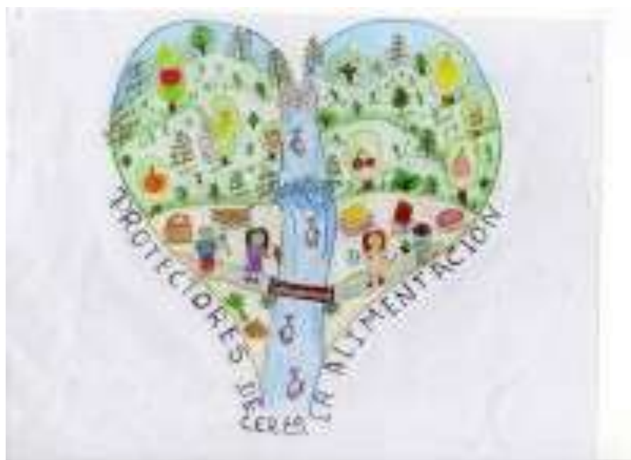
Logo del Semillero de investigación Protectores de la Alimentación diseñado por los estudiantes del CER El Silencio