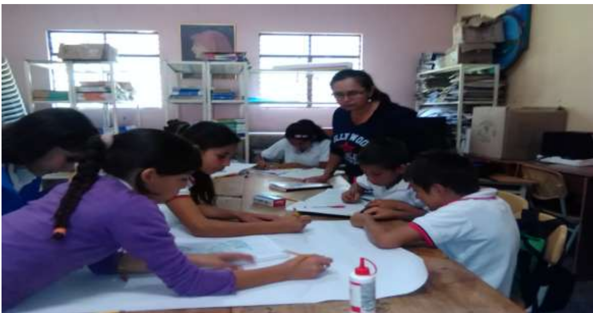
Elaboración de la ruta - trayectoria de la investigación proyecto enjambre (aula enjambre)

Luego para realizar el planteamiento de la pregunta se trabajó a partir de la estrategia de codificación y decodificación de textos visuales, vivencias en la familia y en la comunidad, para posteriormente realizar una oleada de preguntas de la cual salió la pregunta de investigación; los estudiantes tienen una manera muy sencilla de preguntar pero es labor del docente reorganizar esas preguntas para darle la verdadera intención. Después se describió el problema en base a lo que se quería lograr y la importancia de este proyecto para el colegio y la comunidad.