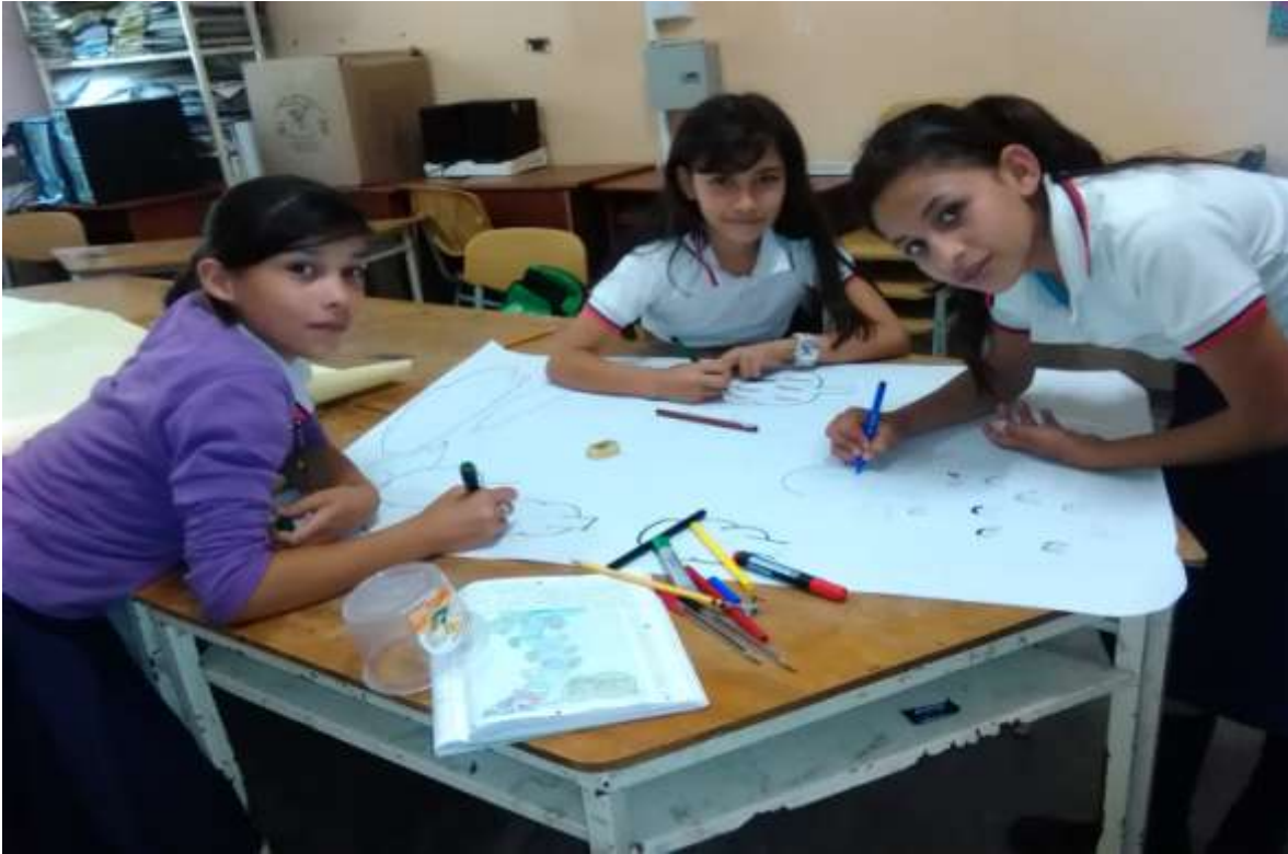
Elaboración estado del arte, bitácora 6(aula de clases)