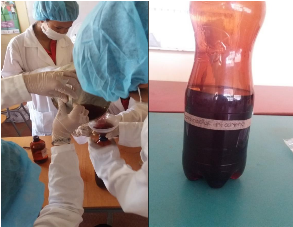
Foto 15. Infusión de cayeno.

Finalmente se hizo una infusión de alcohol etílico (700mL) con pétalos de veranera y dio una solución rosada de la cual fueron extraídos los pétalos y el líquido fue envasado en un recipiente que se rotuló como indicador pH natural veranera.