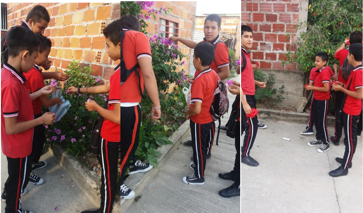
Foto 10. Obtención de las tres flores..

Se obtuvo los 3 tipos de flores que se encontraban alrededor del colegio. 30 flores de chocolate moradas, 20 flores de cayeno rojas y 30 flores de veranera rosadas.