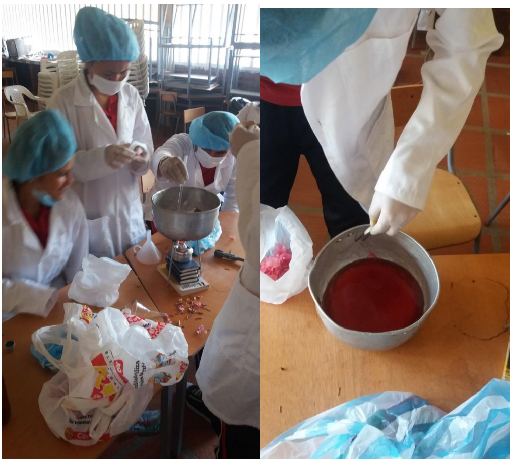
Foto 17. Solucion