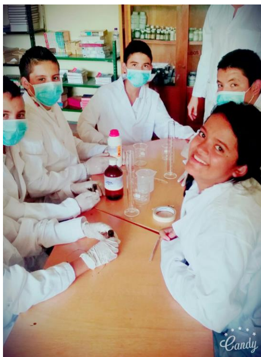
Foto 18. Procedimiento laboratorio