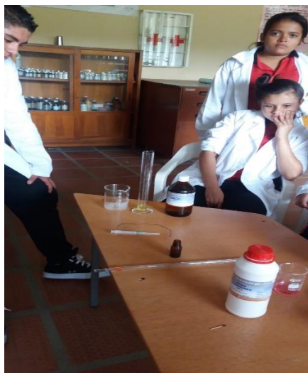
Foto 7. Trabajo práctico.

Seguidamente se sacan 5mL de una base concentrada de color transparente denominada hidróxido de amonio ( \text{NH}_3\text{OH} ) y se introducen en una probeta. Luego se le agrega una pequeña cantidad de indicador y la solución básica toma un color amarillo.