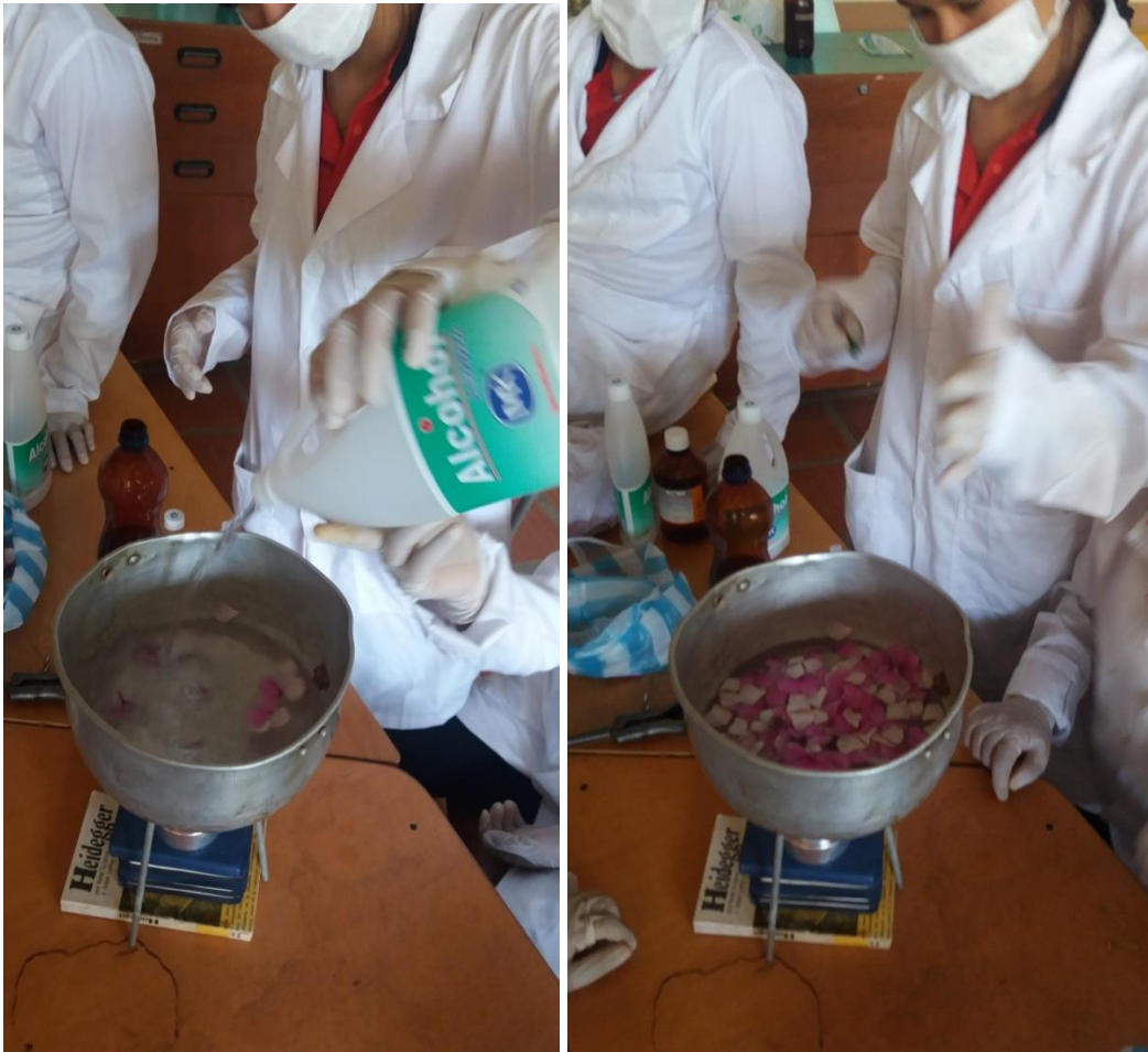
Foto 11. preparación de solución.

envasado en un recipiente que se rotuló como indicador pH natural chocolate