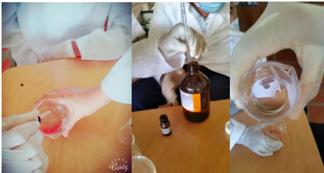
Foto 19. Procedimiento flor de Cayeno.

Se agregó con una pipeta una pequeña cantidad de HCl a un vaso de precipitados, seguidamente unas gotas del indicador pH cayeno, la sustancia ácida tomó un color rojizo. Luego se hizo el mismo procedimiento con el hidróxido de amonio ( \text{NH}_3\text{OH} ) y esta sustancia tomó un color verde oscuro. Finalmente se combina el ácido y la base y obtenemos una sustancia neutra de color morado oscuro.