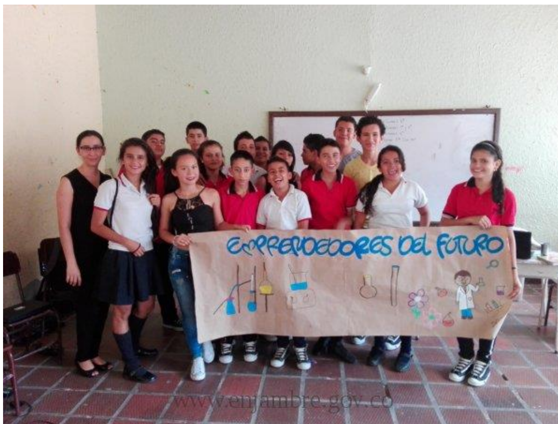
Foto 1. Grupo de investigación emprendedores del futuro.