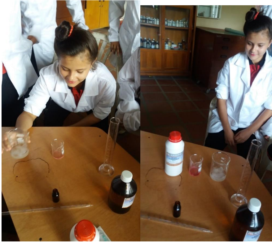
Foto 6. Procedimiento laboratorio

Seguidamente se sacan 5mL de una base concentrada de color transparente denominada hidróxido de amonio ( \text{NH}_3\text{OH} ) y se introducen en una probeta. Luego se le agrega una pequeña cantidad de indicador y la solución básica toma un color amarillo.