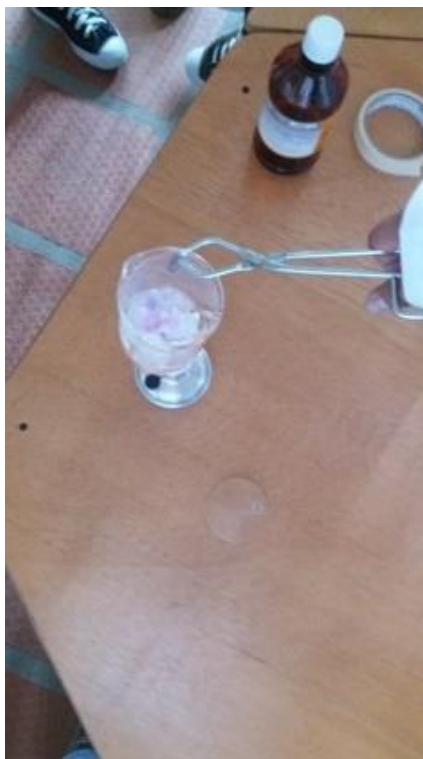
Foto 5. Calentamiento en la mechera

Se deja enfriar y ya está listo el indicador el cual presenta una coloración transparente. Luego se le agrega una pequeña cantidad de indicador a un ácido concentrado que tiene un color transparente el cual se denomina ácido clorhídrico (HCl) y se observa una coloración rojiza