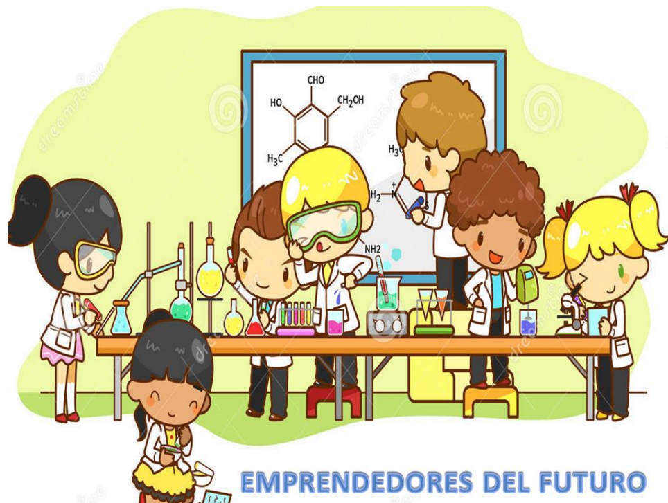
Figura 1. Logo de identificación