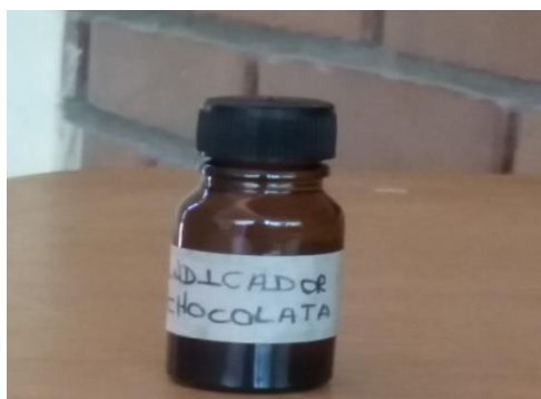
Foto 9. Indicador de chocolate

Finalmente se envasa el indicador obtenido a un frasco el cual se rotula indicador chocolate.