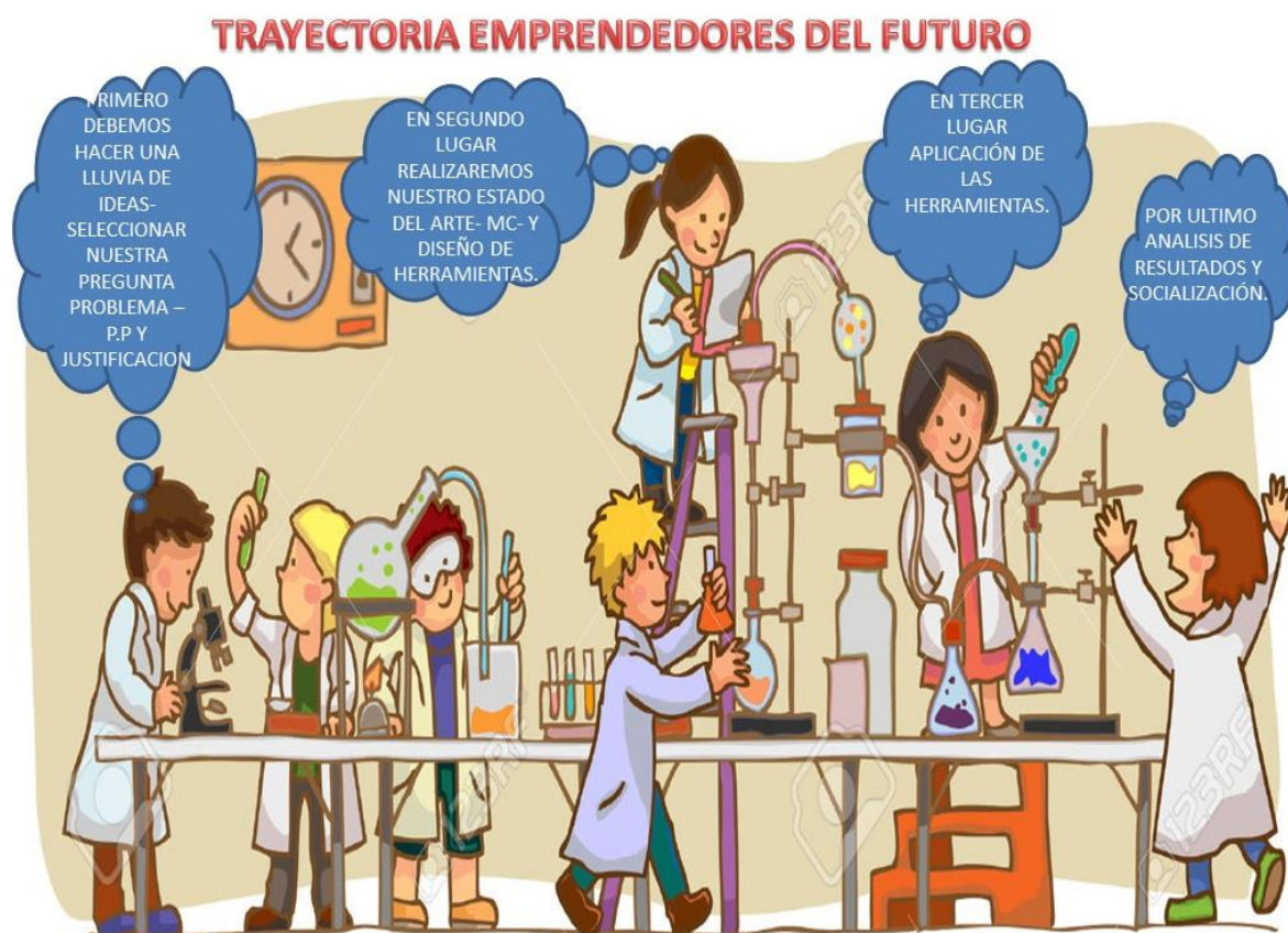
Figura 2. De Mentes Lectoras