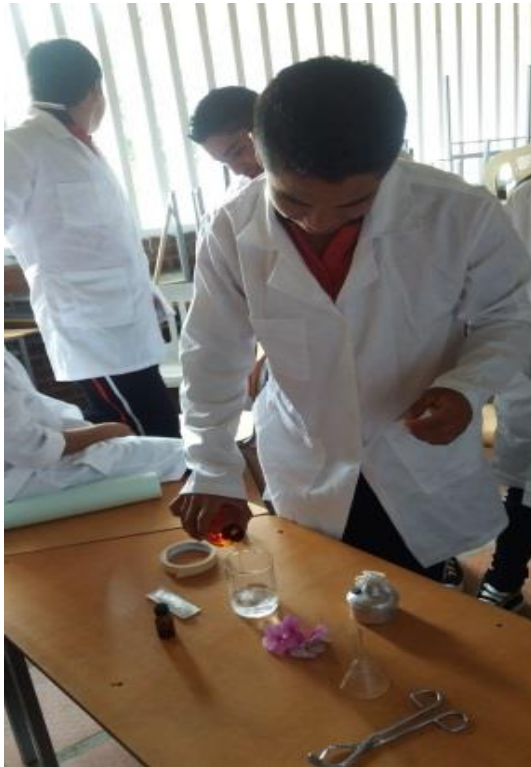
Foto 3. Preparación de alcohol etílico