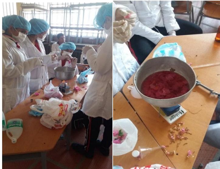
Foto 16. Solución con pelatos de veranera.

Finalmente se hizo una infusión de alcohol etílico (700mL) con pétalos de veranera y dio una solución rosada de la cual fueron extraídos los pétalos y el líquido fue envasado en un recipiente que se rotuló como indicador pH natural veranera.