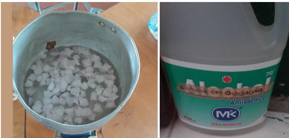
Foto 13. Envase del PH natural chocolate