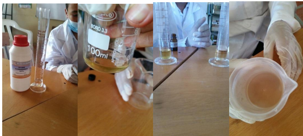
Foto 20. Preparación de solución de veranera.

Luego se hizo lo mismo con el indicador pH veranera, el HCl tomó un color amarillo pálido y el hidróxido de amonio ( \text{NH}_3\text{OH} ) tomó un color amarillo. Al neutralizar las 2 sustancias presentó un color amarillo.