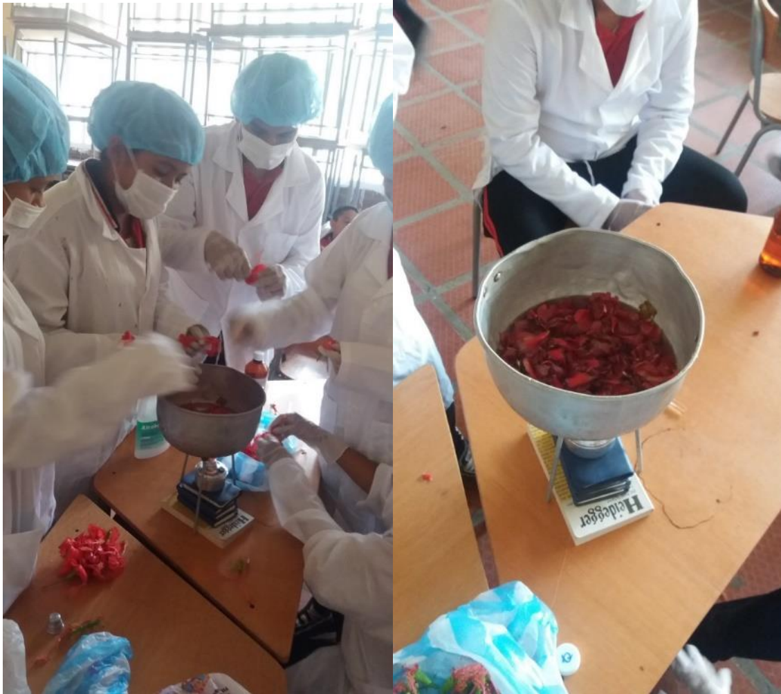
Foto 14. Preparación de solución pétalos de cayeno

La siguiente fue una infusión de alcohol etílico (700mL) con pétalos de cayeno y dio una solución roja oscura de la cual fueron extraídos los pétalos y el líquido fue envasado en un recipiente que se rotuló como indicador pH natural cayeno.