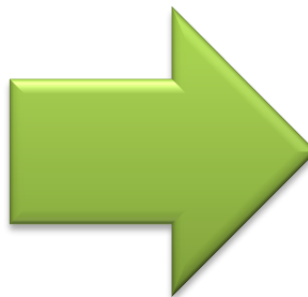
ruta de evacuación