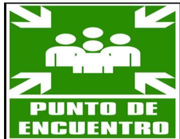
PUNTO DE ENCUENTRO